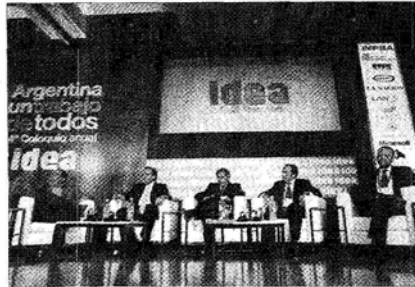
El empresariado, como el año pasado, volverá a darse cita en Coloquio