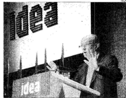
Evento clave. Muchos empresarios evitan IDEA para no disgustar al Gobierno.

El año pasado, Julio Cobos fue en representación de la presidencia (Cristina Fernández de Kirchner estaba de gira por Egipto), pero llegó a la inauguración del convite como un claro opositor.